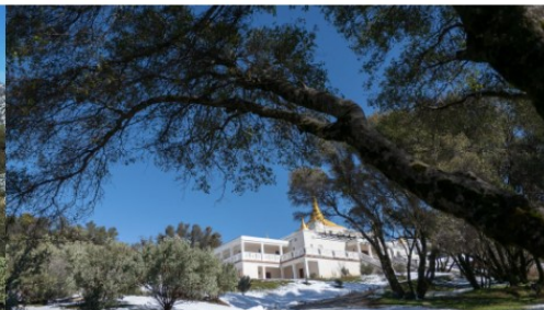
View of Pagoda from Men's Side