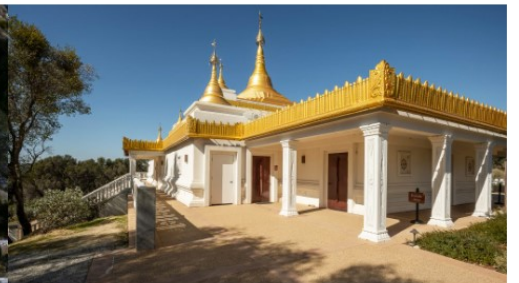
Pagoda from the Women's Side