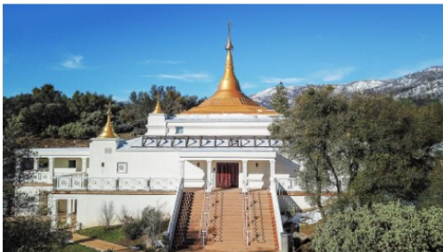
Pagoda from the Men's Side