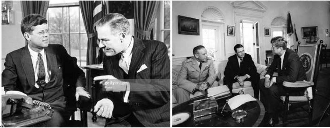
Mùa Hè năm 1963, Tổng thống Kennedy họp với Đại sứ Cabot Lodge (hình trái) và với Tướng Maxwell Taylor và Bộ trưởng Quốc phòng McNamara

■ Ngày 29/8/1963. Các viên chức tình báo CAS gặp Tướng Minh. Buổi gặp do Minh thu xếp. Tướng Minh hỏi chứng cứ rõ ràng rằng Mỹ sẽ không bán đứng họ cho Nhu. Tướng Minh không muốn nói chi tiết về kế hoạch đảo chánh . Khi được hỏi là dấu hiệu nào cho thấy Mỹ sẽ hỗ trợ đảo chánh, Tướng Minh trả lời rằng Mỹ nên ngưng viện trợ kinh tế cho VN.