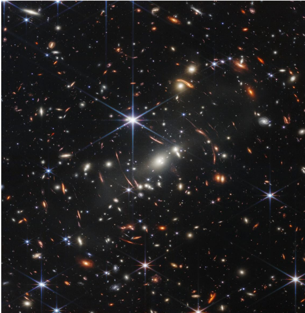
H1_Một vùng vũ trụ cực xa do kính thiên văn không gian Webb chụp năm 2022, góc nhìn vùng không gian này xấp xỉ bằng góc nhìn một hạt cát đặt cách mắt chúng ta một khoảng sải tay. Các đốm sáng có hình dạng khác nhau là các thiên hà. (Các đốm sáng có 6 tia gai nhiều xạ là các sao tiền cảnh ở gần ta, không phải các thiên hà)