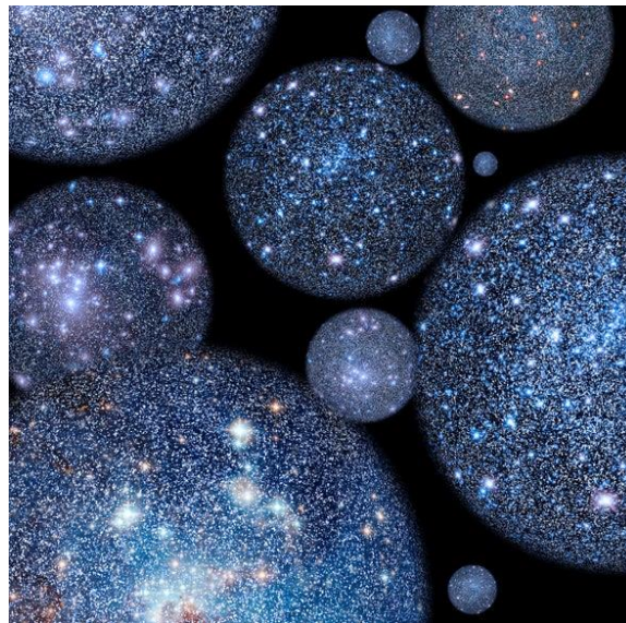
H4_ Vũ trụ song song trong biển đại giác (hình minh họa)

H3_ Thiên hà chứa hệ mặt trời ta đang sống có tên là dải Ngân Hà (Milky Way)_ Tất cả các sao ta thấy trên bầu trời (các chấm sáng trên hình) đều là các sao thuộc dải Ngân Hà, chúng ở gần nên ta mới phân biệt được bằng mắt thường, còn vô số các sao ở xa (cũng thuộc dải Ngân Hà) ta không phân biệt được mà nhìn thấy chúng chỉ chít hợp thành một vệt sáng vắt ngang bầu trời, giống như một con sông bạc (ngân hà). Ở thành thị khó thấy được dải Ngân Hà vì bị ánh sáng đô thị che lấp