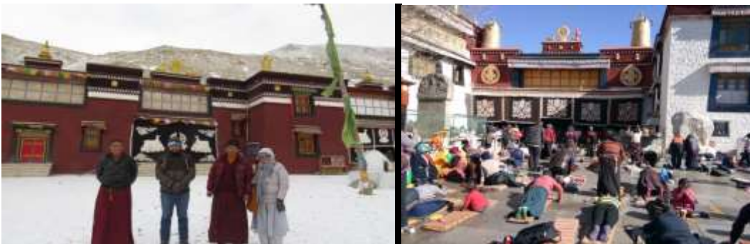
(Hình Quý Sư Tây Tạng và Ni sư Giới Hương cùng lạy Ngũ thể sát đất tại Jokhang Temple, Lhasa, vào mùa đông tháng 1 năm 2019)

Facebook: https://www.facebook.com/huongsentemple