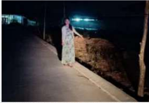
các Ngài hào phóng ban cho tôi còn nhiều hơn thế. (Đây là mảnh đất chúng tôi mua được)

học trò khác cho vay là đủ, và vị thầy cũng biết vợ chồng Giác Đăng vẫn còn “của hồi môn” của cha mẹ chồng cho một mảnh đất chưa bán, biết được tổng thể ‘kết tiền’ của trò, cho nên đạo sư nói một ý xa xa rằng: “Các ông sẽ có nhà, đừng lo”