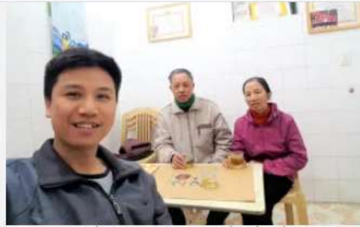
Cùng uống trà và nói chuyện về Thầy, về Phật

Bữa cơm đã kết thúc lúc 23 giờ, tôi trở lại với căn gác nhỏ tĩnh lặng, nơi có chiếc máy tính của đạo hữu Tấn Lực để truy cập vào lâu đài Duy Ma Cật chanhtuduy.com , phía trên tôn trí linh ảnh Bổn tôn, để nhớ lại những sự kiện năm 2020 của tôi và nhìn nhận quán xét bản thân mình. Như Thầy dạy “vấn đề không phải là cũ mới, mà vấn đề cốt lõi là lòng sùng mộ chẳng khác xưa” “đời người không tính bằng thời gian là bằng những gì đã làm được”, nhất là trên bình diện đạo pháp. Tôi cảm niệm mình và 2 đạo hữu “nhà tôi” đã may mắn biết nhường nào khi được hạnh ngộ, nương tựa nơi Tuệ trí thức, người luôn “ẩn mình chẳng tự hào” nhưng luôn dũng mãnh đã tã xây chánh trước sự vây bủa của thế lực tà kiến, tà quyền, chưa bao giờ ngại ngại bước chân hoạt dụng Bồ đề vì sự lợi lạc của tất cả chúng sanh. Tựa như nhánh mai vàng bừng nở kiêu hãnh trước gió đông, mang mùa xuân đạo pháp sưởi ấm cuộc đời. Chúng tôi thật may mắn vì luôn được lân cận và được lan tỏa phẩm tính cao cả của vị Phật nơi Thầy, cái Bi – Trí – Dũng của vị Đạo sư Thanh Trí thông qua các phương tiện đầy thiện xảo.