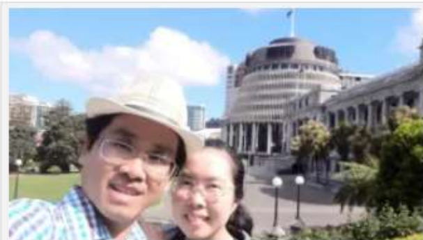
Niềm hạnh phúc đây ơn phước!

chanhtuduy.com/thu-newzeland-nghi-khong-ra-ban-khong-den-ben-khong-thuyen-duyen-tien-kiep/