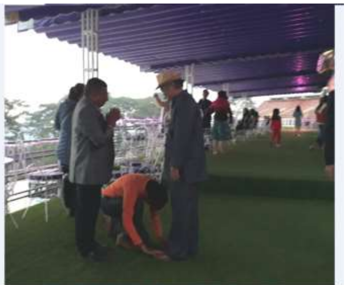
Quý và hôn lên bàn chân 1 vị đạo sư "dòm" và "tự xưng"

(Ảnh 10-Vị giáo sư Tantra Sutra Daka cung kính đánh lễ một vị tà sư lưu manh)