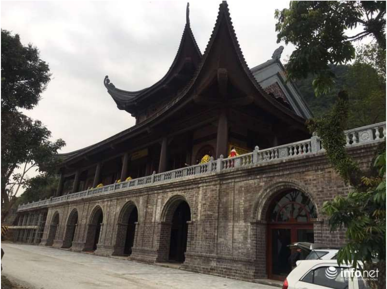
Phía trước đền Tứ Ân.