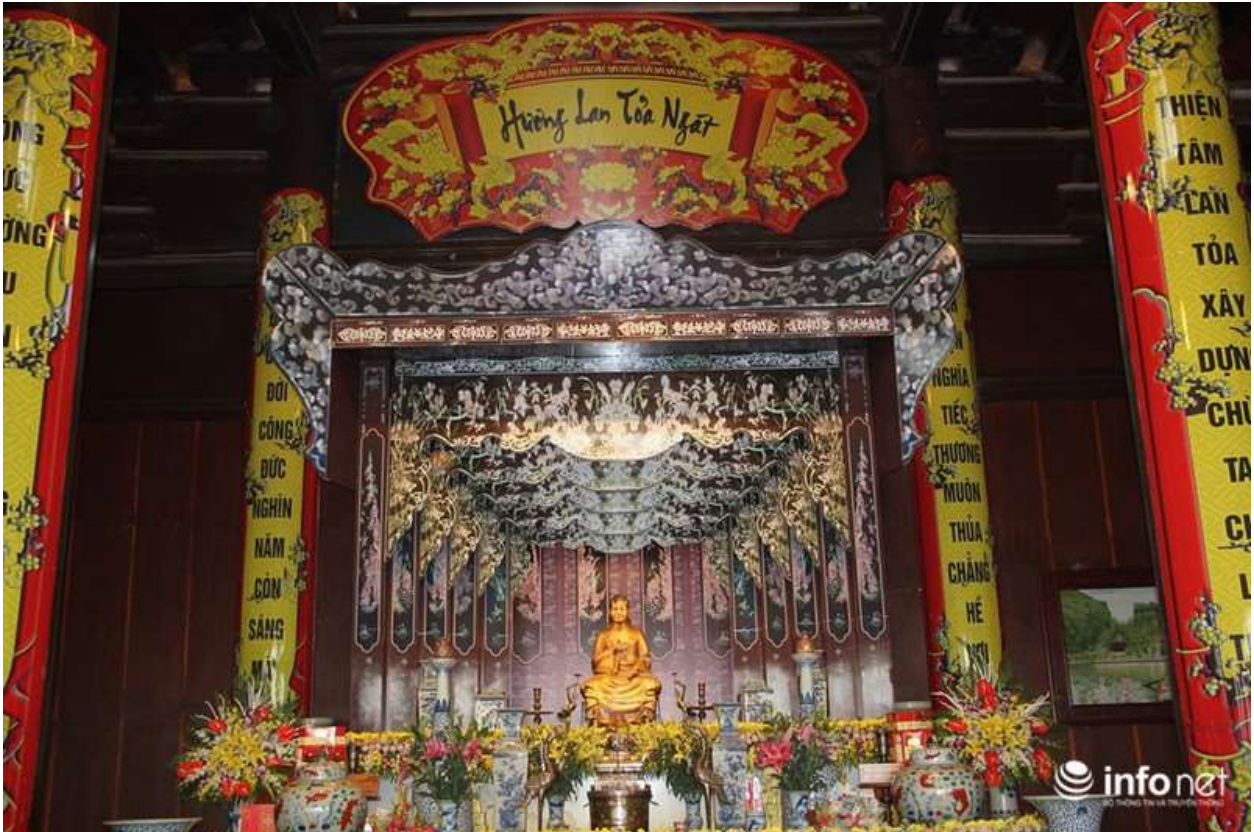
Chủ nhân của ngôi đền.