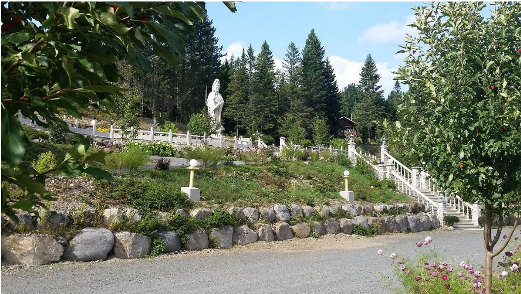
Tượng Quan Âm lộ thiên