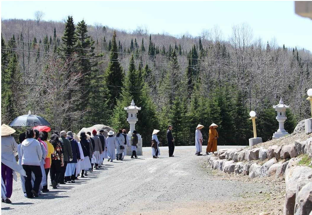
Thiền hành (mùa hè)