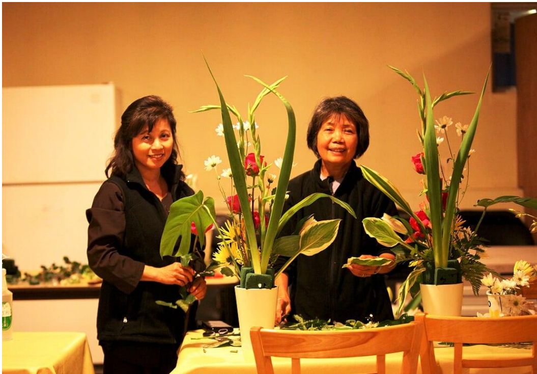
Cắm hoa cúng dường Phật