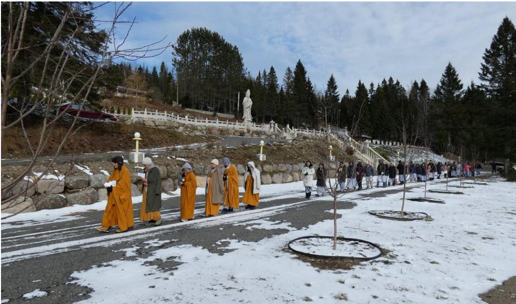
Thiền hành (mùa đông)