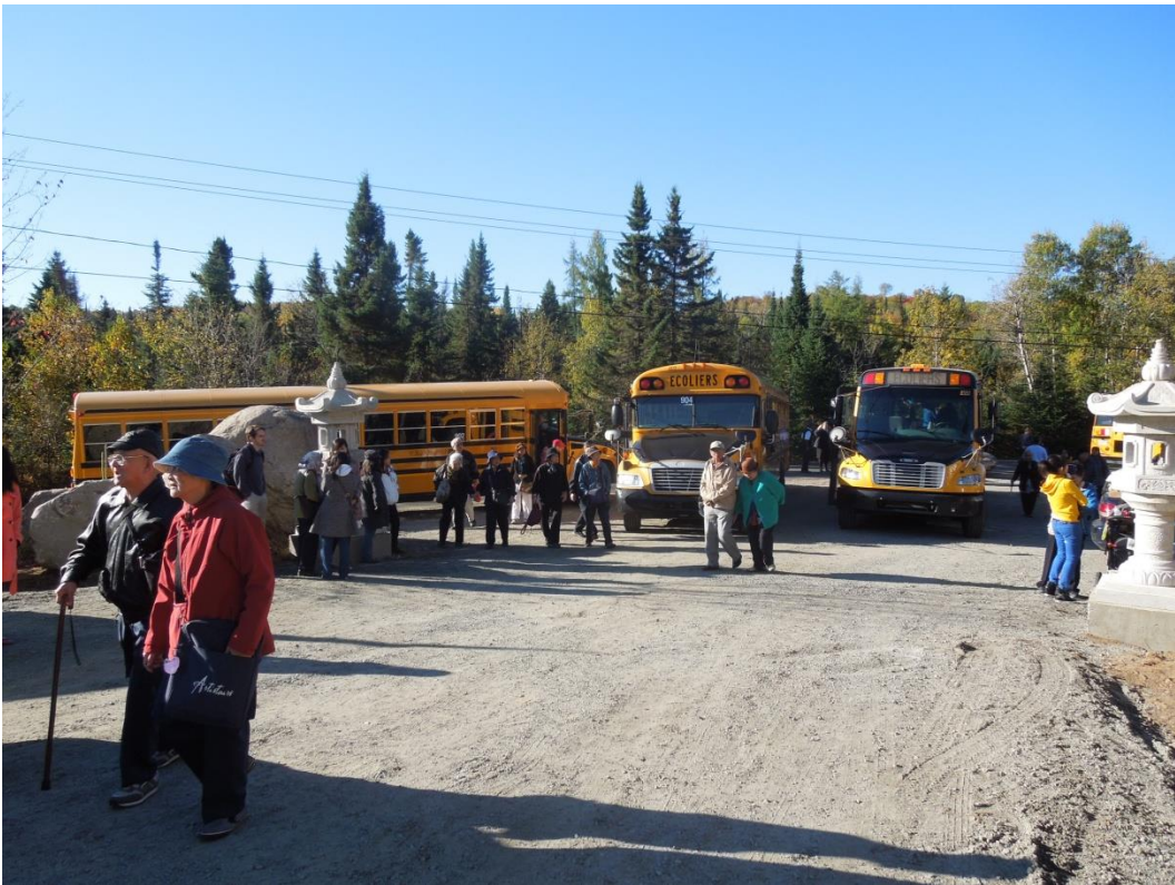
Xe bus chở Phật tử Montréal đi lễ chùa (đi mất khoảng 1g 15ph)