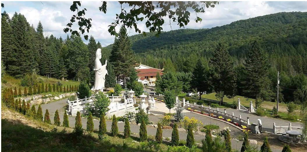
Toàn cảnh tv. Đạo Viên