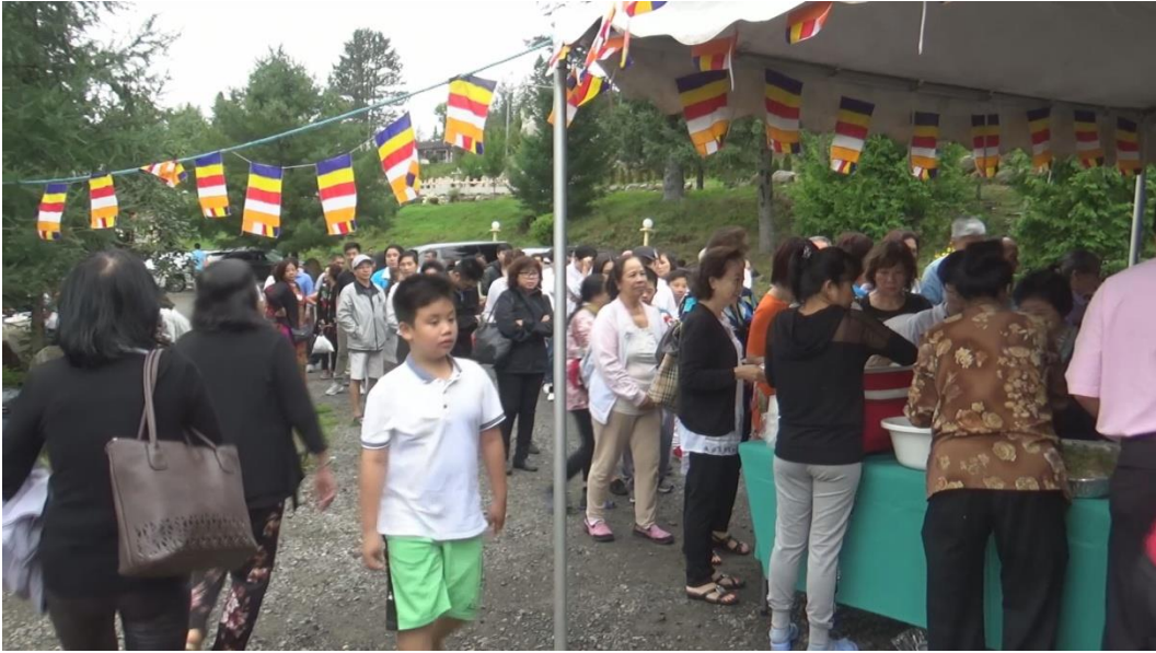
Phật tử xếp hàng lãnh đồ ăn