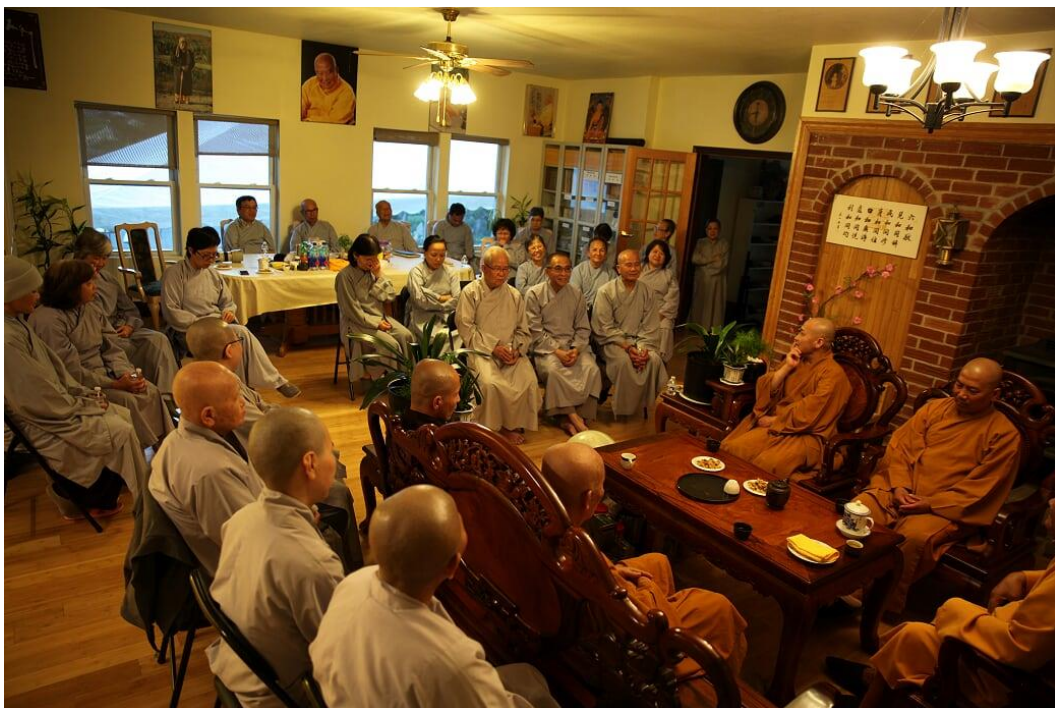
Một buổi họp mặt Tăng Ni và Phật tử