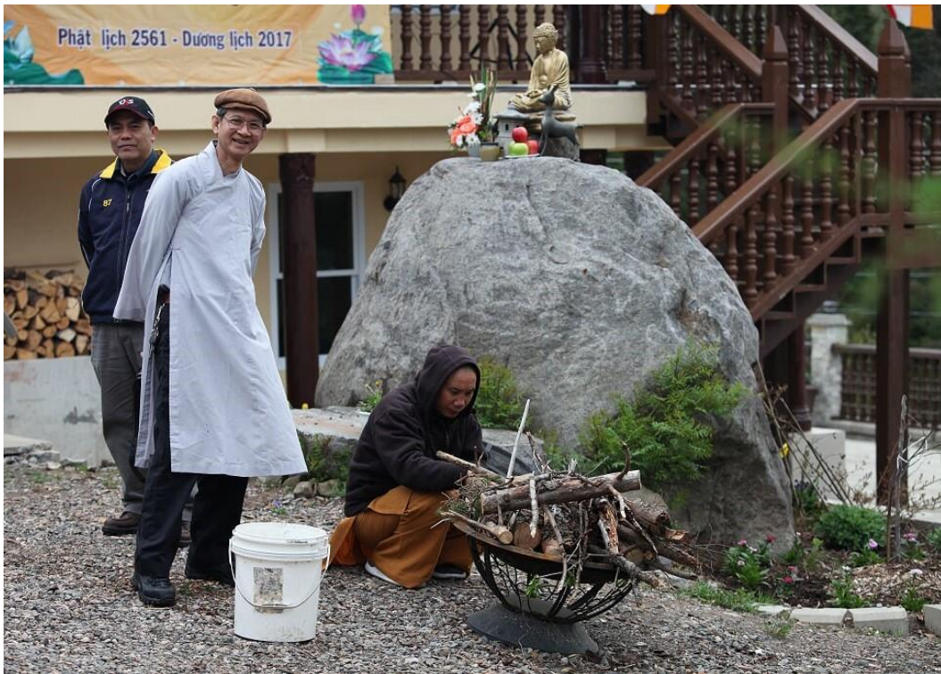
Đốt củ sưởi ấm