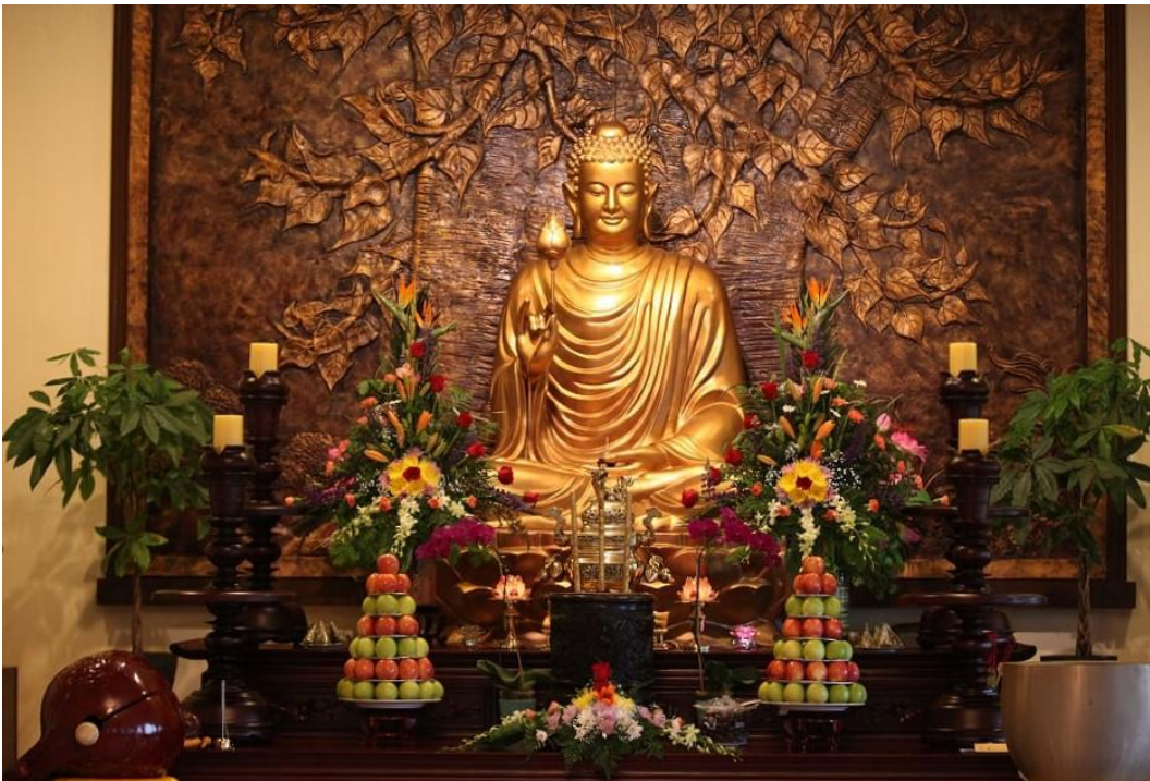
Tượng Phật (bằng đồng) tại chánh điện