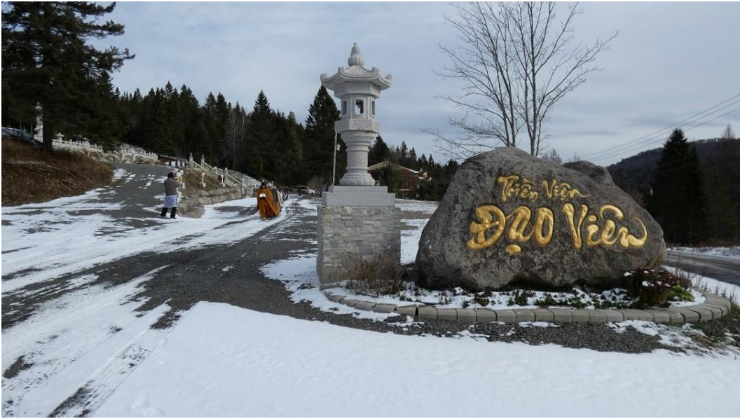
Lối vào thiền viện