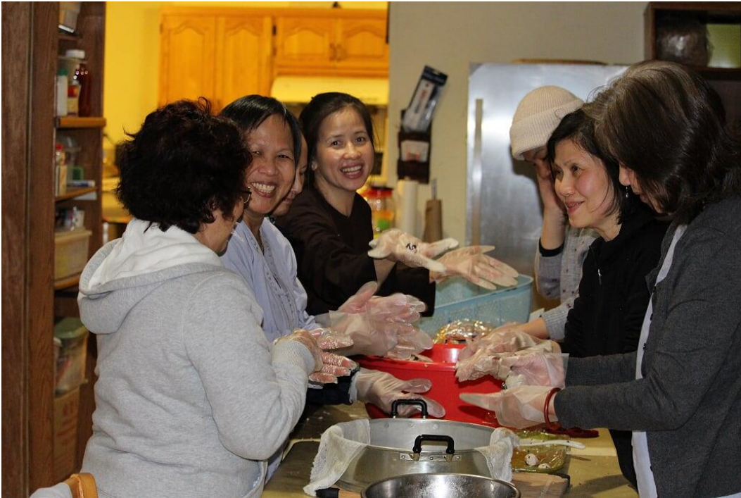
Ban trai soạn