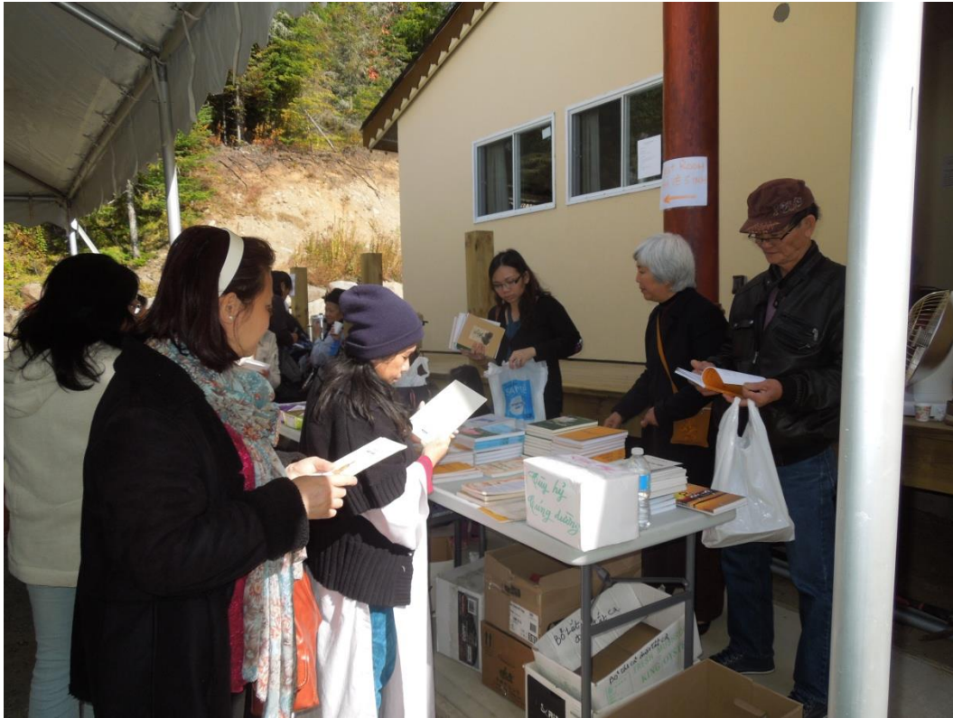
Phật tử thỉnh kinh sách, băng đĩa