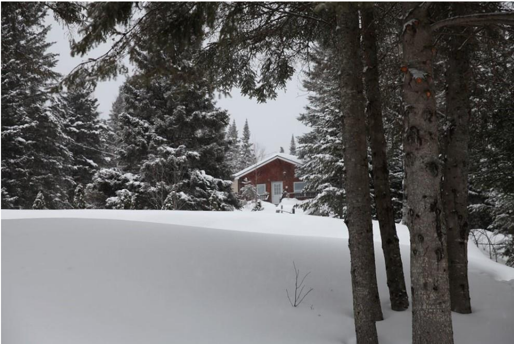
Thiền thất 1