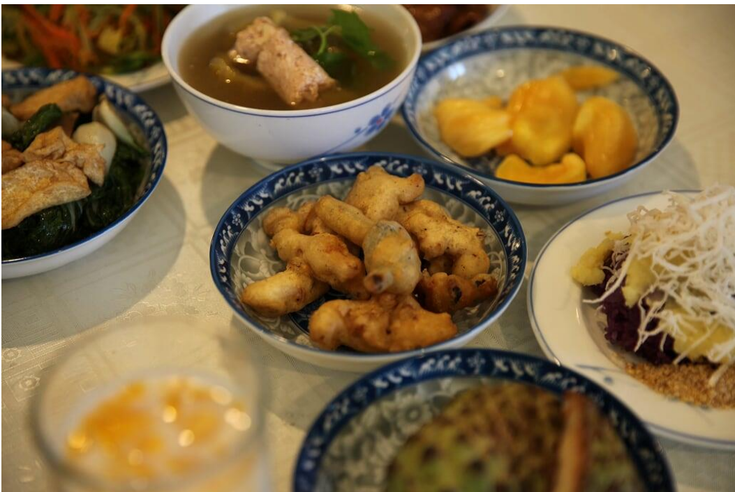
Đồ ăn thanh tịnh, bổ dưỡng, ngon miệng, sản phẩm của ban trai soạn