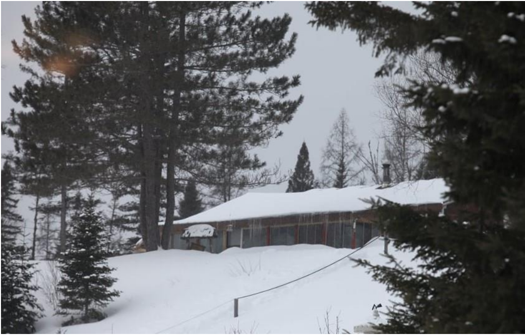
Thiền thất 2