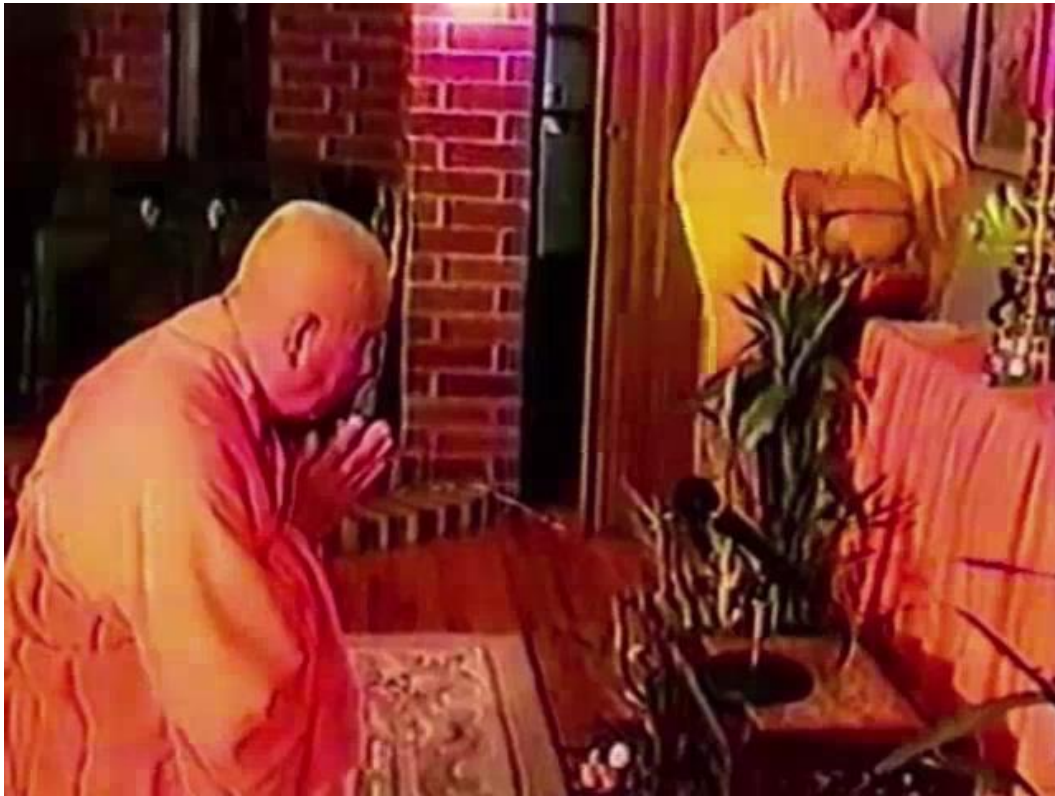
HT. Thích Thanh Từ chủ lễ An vị Phật tại tv. Đạo Viên (13.10.2002)