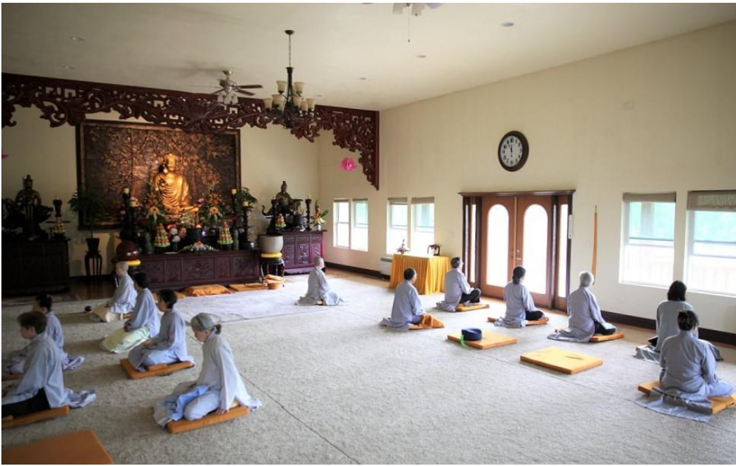
Phật tử toạ thiền