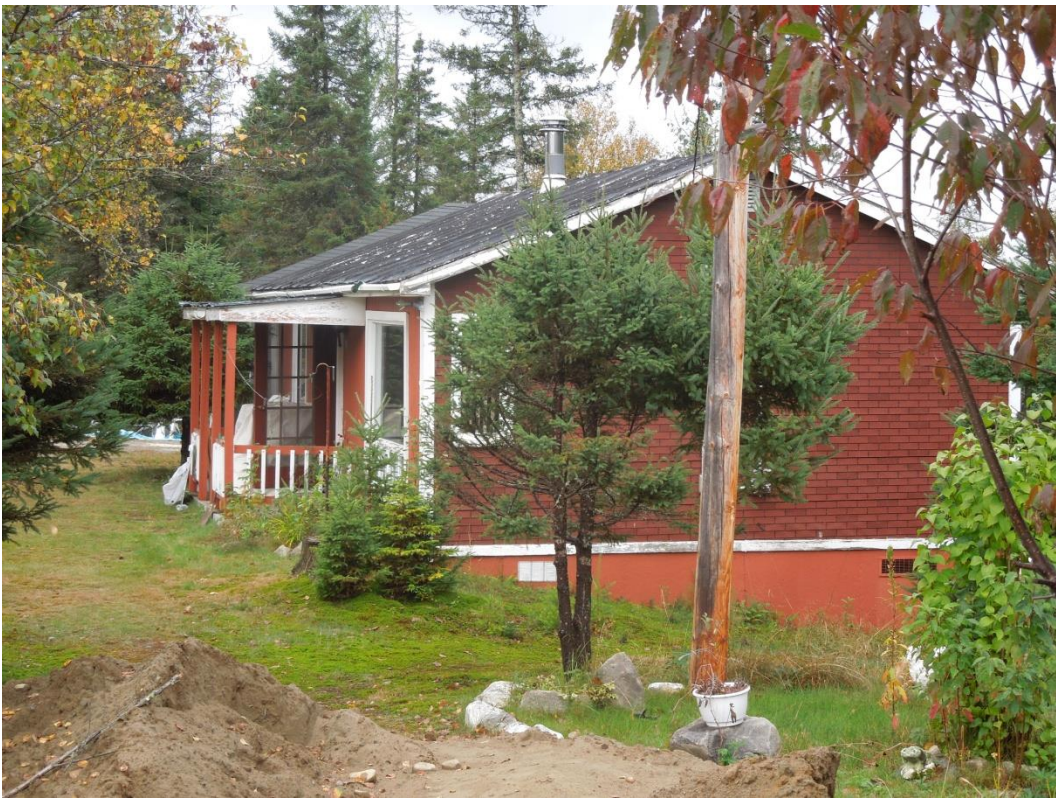
Thiền thất 3